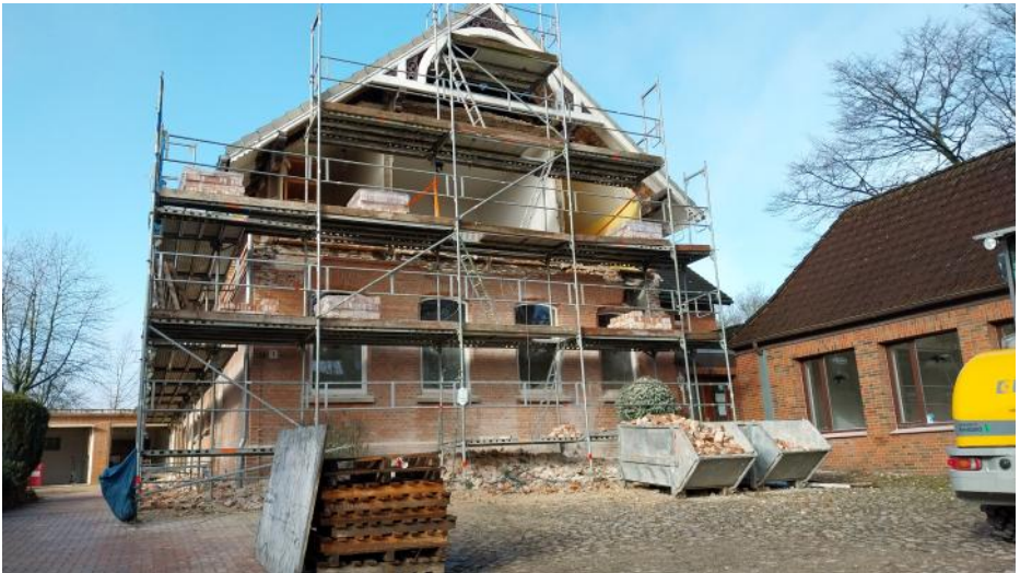
Der Rückbau am Pfarrhaus hat begonnen.