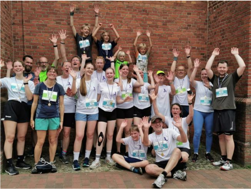
Die erfolgreichen Läuferinnen und Läufer nach dem Spendenlauf vom 28. Juni 2025.