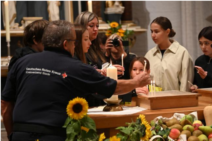
Die Kinder aus Mykolajiw und ihre Mütter zünden bei einer Andacht am Altar Kerzen für ihre vermissten oder verstorbenen Angehörigen an.